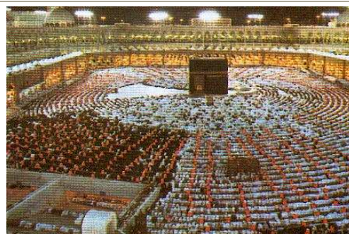
KAABA DE MAHOMET EN ARABIE SAOUDITE